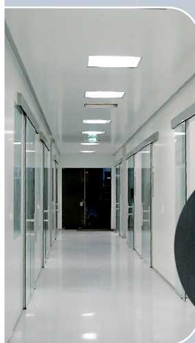
ЧИСТЫЕ ПОМЕЩЕНИЯ панели, двери, окна