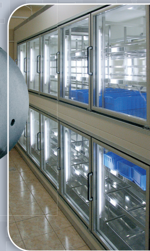
СТЕКЛЯННЫЕ ФРОНТЫ для холодильных камер

«ТЕЛЕДООР» 127051, Москва, ул. Трубная, д. 21 Тел.: (495) 662-57-11 E-mail: info@teledoor.info www.teledoor.info